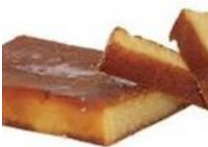
Turrón de yema