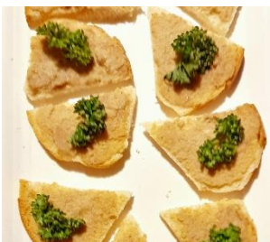
Paté de boletus Pâté de cèpes