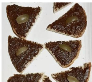
Paté de morcilla con uvas Pâté de boudin aux raisins frais