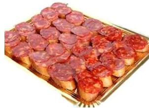
Montadito de chorizo y tomate Canapé de chorizo et tomate