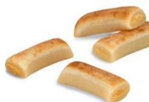
Huesos de Santo

Os de Saint Massepain à la crème de jaune d'œuf