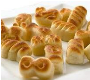
Figuritas de Mazapán