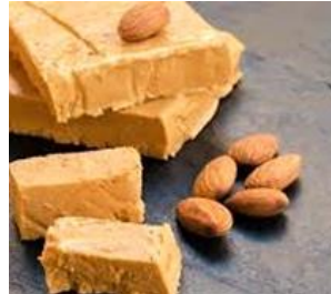
Turrón de Jijona