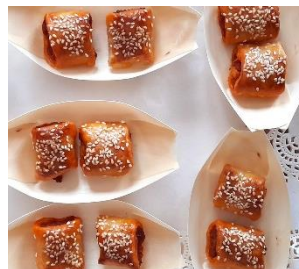
Delicias de sobrasada Délices de soubressade