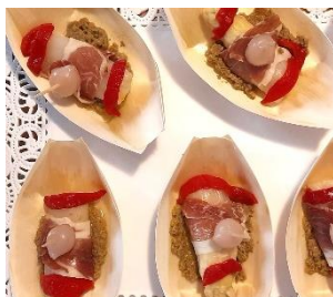
Espárragos aderezados Asperges assaisonnés