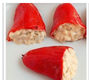
Pimientos rellenos Poivrons farcis