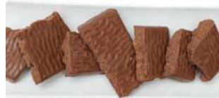
Turrón de chocolate y avellanas