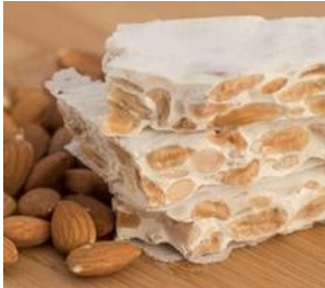
Turrón de Alicante