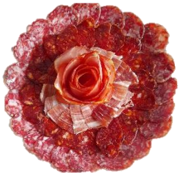
Flor de embutidos : Fleur de charcuterie