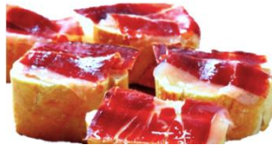
Montadito de jamón y tomate Canapé de jambon et tomate