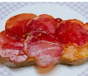
Montadito de lomo y tomate Canapé de filet séché et tomate