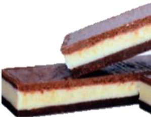
Tableta de los tres chocolates