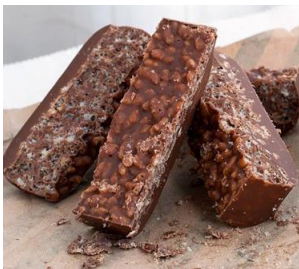
Chocolate con galletas