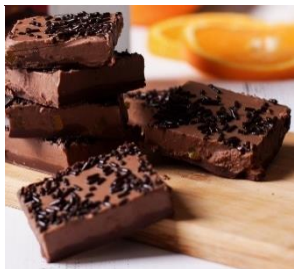
Chocolate con naranja