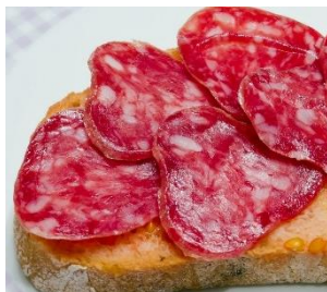
Montadito de salchichón y tomate Canapé de saucisson et tomate