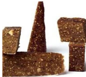
Pan de higos con nueces