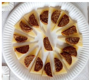
Queso con pan de higo y nueces Fromage avec pain de figues aux noix